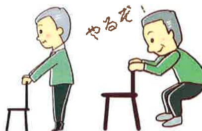
椅子を使ってしっかり筋トレ