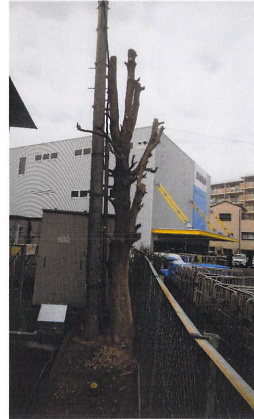
剪定作業後 すっきりしました。 電柱も見えました！