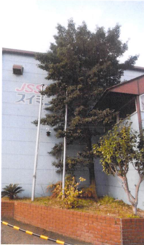
玄関側 剪定前 こちらの木もおいおいと茂って 深井スイミングの文字も見えなく なっていました。