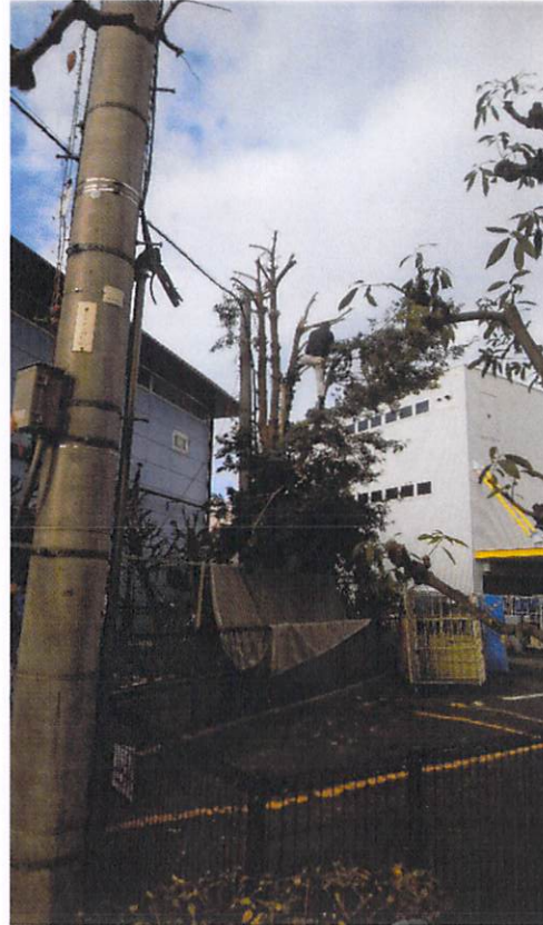
剪定作業中 さあ、剪定作業開始です。 作業車が入れない中、直接木に 登っての剪定作業ご苦労さまです。