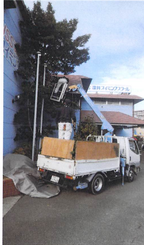
剪定作業中 こちらは作業車も問題なく入り 安全な状態で作業ができました。