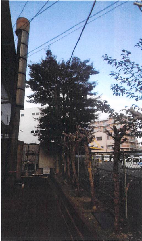
機械室シャッター前 剪定前 オープンから35年も経つと 電柱も見えなくなりなした。