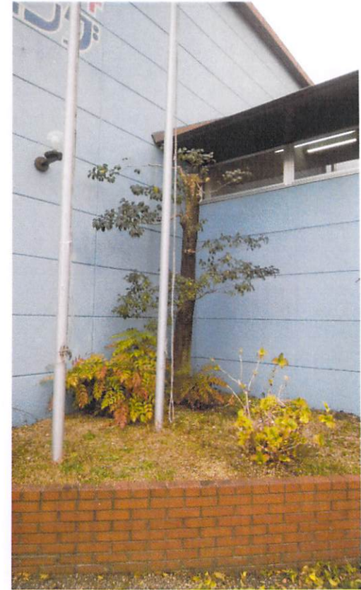
剪定作業後 こちらもしっかりさっぱり！ スイミングの文字もしっかり 見えました！