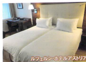
ルツェルン・ホテルアストリア