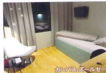
キャンパス・ズールゼー