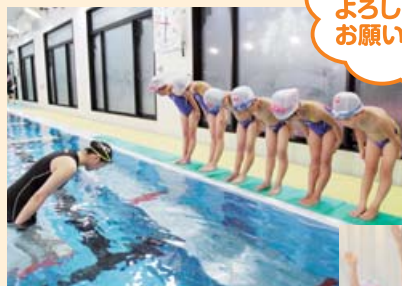
しつけ、マナー指導も充実!