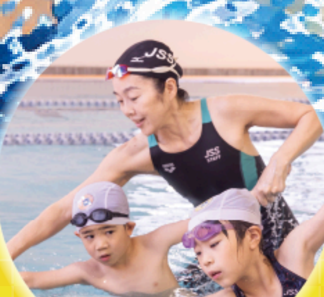
進級基準でステップアップ