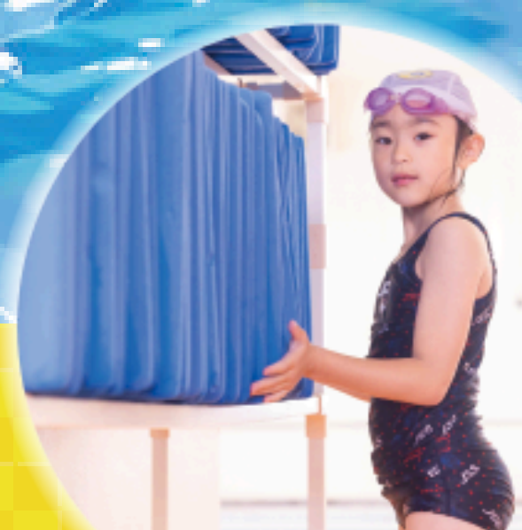
ルール・マナーの習得