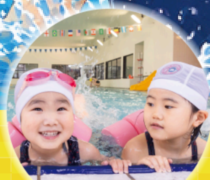
安心・安全ヘルパー指導