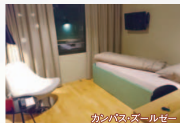
キャンパス・ズールゼー