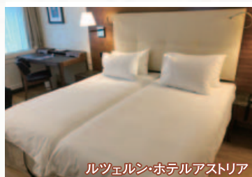
ルツェルン・ホテルアストリア